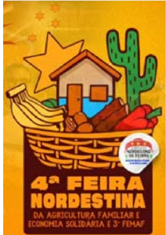
Figura 4 - Cartaz 4ª FEMAF

Ainda existem diferenças na qualidade dos produtos, mas a preocupação com a qualidade tem crescido. E a certificação pela SAF tem contribuído com isso.