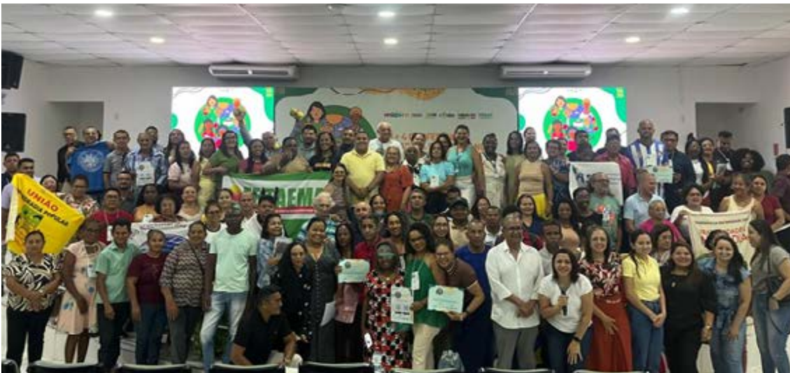
Figura 13 - Plenária final 05 de dezembro