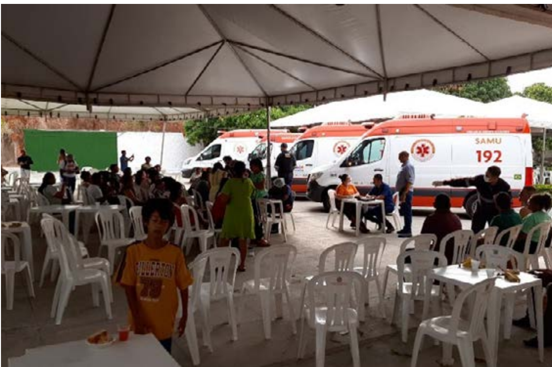
Figura 12 - Excelente serviço do SAMU no atendimento dos doentes

Cabe registrar que diante da inesperada fatalidade, houve uma pronta solidariedade entre os participantes do evento, de conselheiros estaduais até daqueles e daquelas que sofriam dos mesmos sintomas. Contaram com o apoio total da Secretaria Estadual de Desenvolvimento Social, da Secretaria Estadual de Saúde, do SAMU e das Vigilâncias Sanitárias dos Municípios de São José de Ribamar, da São Luís e do Estado do Maranhão. Especial menção merece a Diretoria e os funcionários do CESIR/FETAEMA, que tudo fizeram para amenizar os incômodos para as pessoas afetadas.