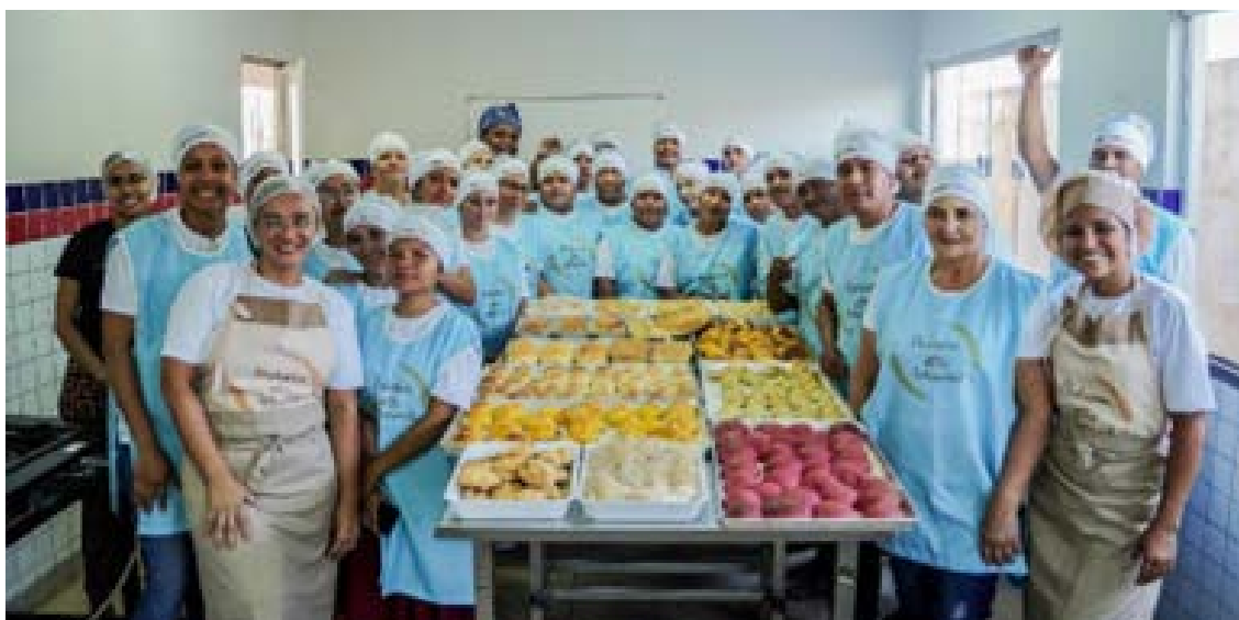
Figura 5 - Cozinheiras da padaria artesanal