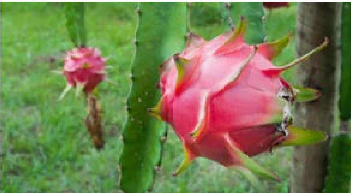
Figura 6 - Pitaya

Há pessoas que questionam a localização do equipamento, escondido no fundo da Central de Abastecimento. O potencial que existe de arrecadação dentro de uma CEASA é muito maior do que em qualquer outro lugar e essa é a vantagem da sua atual localização. Os números de alimentos recuperados não mentem a respeito disso. Todos os blocos da CEASA contribuem com produtos. 107 instituições estão cadastradas para receber os alimentos higienizados. A maioria das entidades receptoras utilizam os alimentos para preparar refeições em creches, em escolas, para crianças, mas há distribuição também para famílias e pessoas físicas em situação de vulnerabilidade social e alimentar. O pessoal do Banco também dá orientações sobre como utilizar, preparar e processar os alimentos para cozinheiras nas escolas ou pessoas das comunidades. Até alimentos pouco conhecidos pela população, próprios de outras regiões, mas valiosos, podem ser levados para a mesa das famílias, como aconteceu numa creche que recebeu pitaya e suas cozinheiras não sabiam como usar.