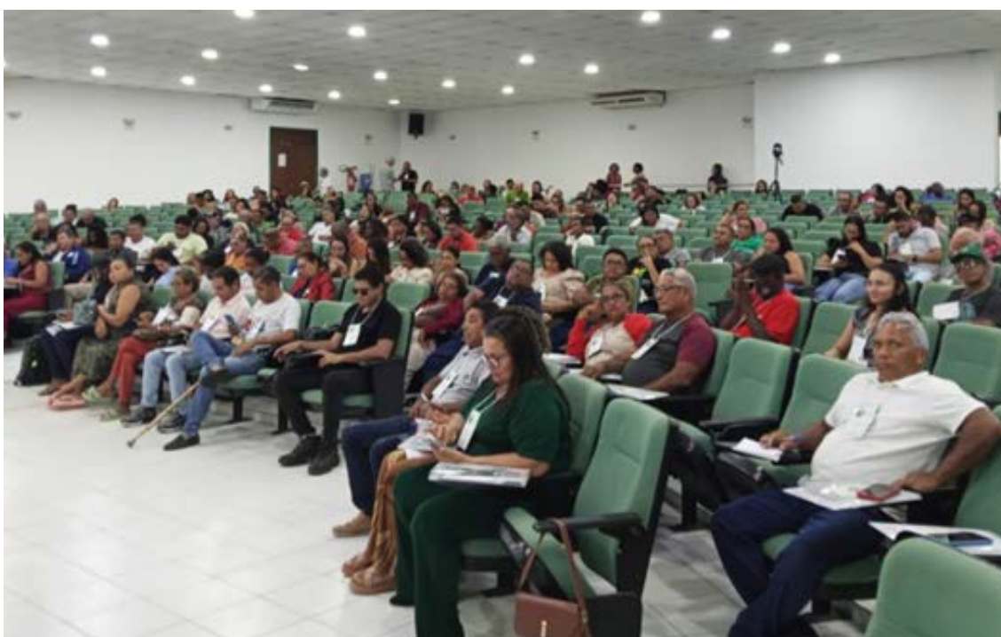
Figura 2 - Vista parcial da Plenária

O presidente introduziu a apresentação da leitura do Regulamento do evento, que tinha sido disponibilizado para todas as pessoas através de um QR-code. Esclareceu que algumas modificações de última hora seriam introduzidas, por causa de informações sobre o Encontro Nacional de SAN, que tinham chegado no dia anterior. Não será realizada uma Conferência, mas um Encontro Nacional VI+2. Está agendado para o mês de junho de 2026 e terá participação limitada dos Estados, com apenas seis representantes, sendo o Presidente do CONSEA Estadual, o Presidente ou Secretário-executivo da CAISAN Estadual e mais quatro pessoas com notório conhecimento e participação na Política de SAN e representando as populações vulneráveis com capacidade de contribuir significativamente, um do poder público e três da sociedade civil. Os CONSEAs Estaduais ficaram responsáveis pela indicação destes representantes. Isso significava que não haveria eleição de delegadas/os no decorrer desta conferência. O evento contará com no máximo 250 pessoas. A VII Conferência Nacional será realizada provavelmente em 2027.